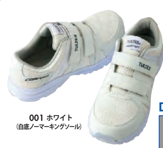
001 ホワイト (白底/ノーマーキングソール)

AZ-51651 セーフティシューズ (面ファスナー) (男女兼用) 【22.5~28cm】