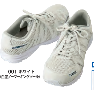
001 ホワイト (白底/ノーマーキングソール)

当社アイスバックのゲル化剤は食品添加物タイプを使用しているため、人体に安心・安全です。また、焼却して処分できることから環境にも優しい物質と言われています。